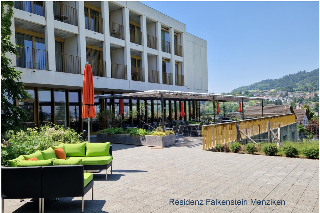
Residenz Falkenstein Menziken

Spitalverein Wynen- und Seetal Schwarzenbachstrasse 9 5737 Menziken Tel. 062 765 80 00 spitalverein.ch